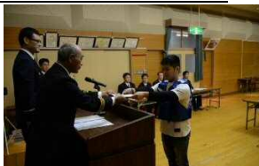
学生団員、辞令交付式の様子

大学、専修学校等在学中に本市消防団に入団し、主に消防団PR活動、普通救命講習の指導等の消防団活動を行う学生の団員 の事をいいます。入団した学生は防災知識の修得、消防団員としての貴重な経験ができます。また名取市では「学生消防団員」としての活動実績を名取市長が認証する事により、 就職活動時に自分のアピール材料等として使用できる「認証証明書」を交付する「学生消防団活動認証制度」を導入しております。 興味のある学生の皆さんの入団お待ちしております。